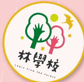
林學校體驗課程套票