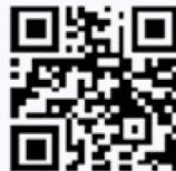
內政部警政署 165全民防騙網