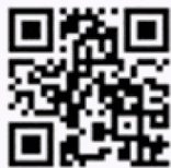
教育部詐騙 防制專區

教育部與內政部持續緊密合作，提供孩子最即時的協助與支持。如果孩子遇到任何可疑情況或懷疑自己受騙，可以撥打「反詐騙諮詢專線165」或使用警政服務APP尋求幫助，希望每位孩子都能在保護自己的前提下，盡情享受學習、體驗新事物，度過一個充實且愉快的假期。