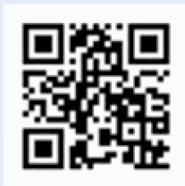
教育部詐騙 防制專區

教育部與內政部持續緊密合作，提供孩子最即時的協助與支持。如果孩子遇到任何可疑情況或懷疑自己受騙，可以撥打「反詐騙諮詢專線165」或使用警政服務APP尋求幫助，希望每位孩子都能在保護自己的前提下，盡情享受學習、體驗新事物，度過一個充實且愉快的假期。