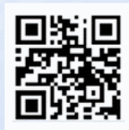
內政部警政署 165全民防騙網