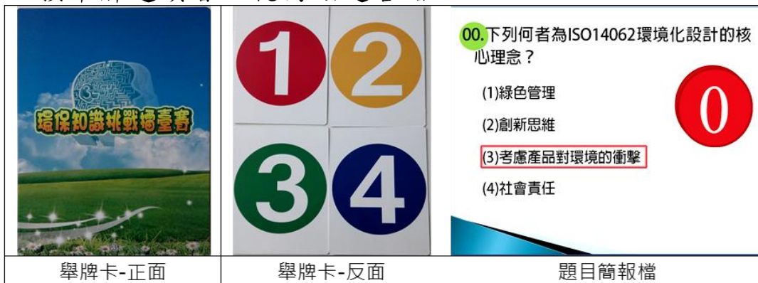
圖 1. PK 賽數字舉牌及題目簡報

十一、司儀宣讀題目後唸出「請準備」，參賽者手持選定牌子但不舉起，待司儀唸出「3、2、1，請舉牌」時，全體參賽者必須同時將牌子舉起至胸前高度，未舉牌或更換舉牌選項者，視同該題答錯。