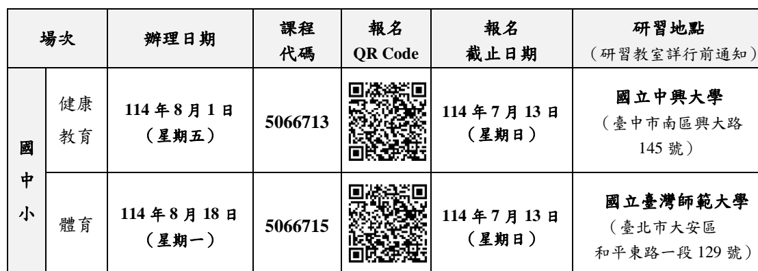
表 2 課程內容與研習時數