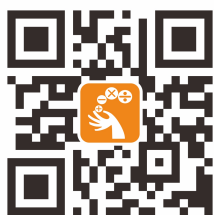
中華數學協會官網