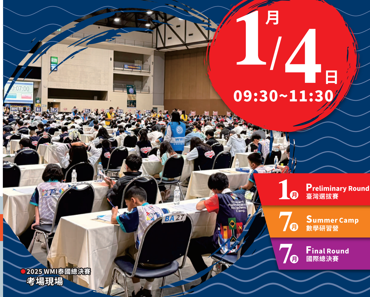
● 2025 WMI泰國總決賽考場現場