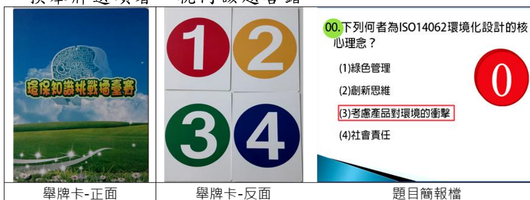
圖 1. PK 賽數字舉牌及題目簡報

十一、司儀宣讀題目後唸出「請準備」，參賽者手持選定牌子但不舉起，待司儀唸出「3、2、1，請舉牌」時，全體參賽者必須同時將牌子舉起至胸前高度，未舉牌或更換舉牌選項者，視同該題答錯。